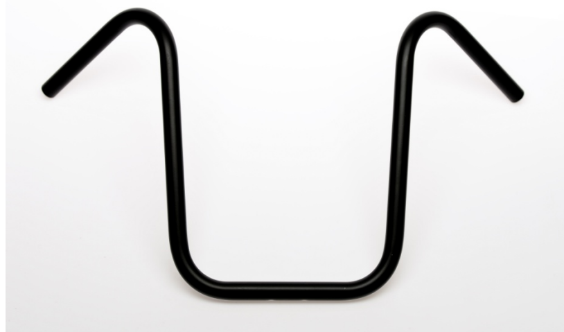
Typ / Type: Bad Ape 40