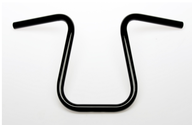
Typ / Type: Anfora 40