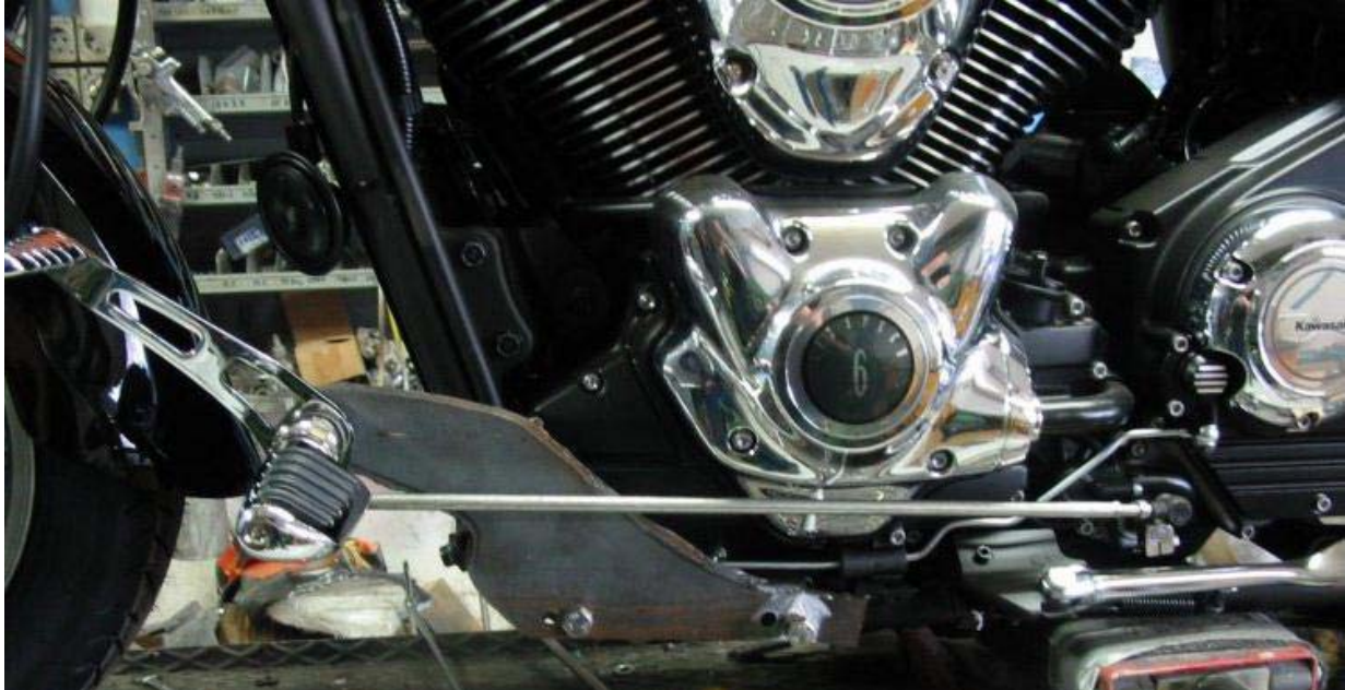
Hier noch Prototyp, d.h. nicht poliert