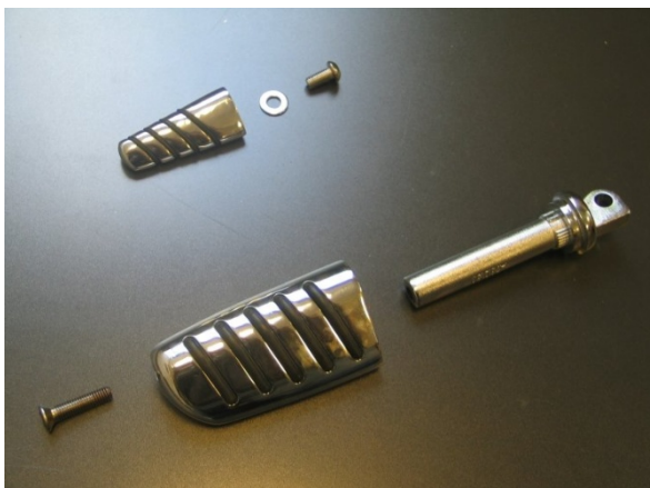
Ausführung Tech Glide